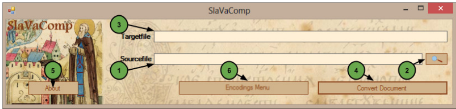
Abbildung 1. Hauptmenü