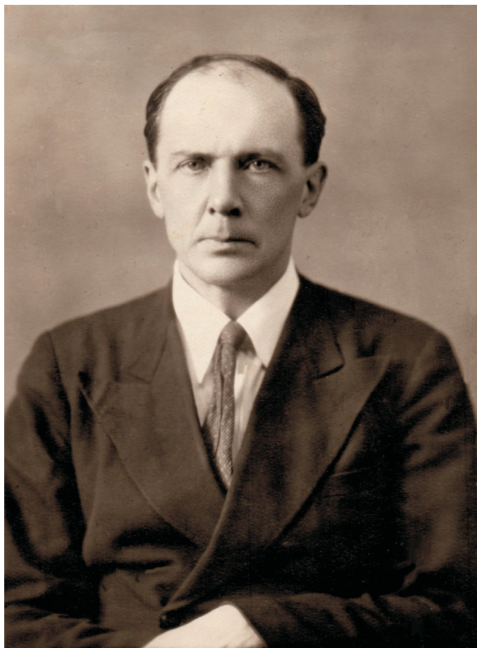
А. Н. Насонов

Фотография конца 1930-х – начала 1940-х годов