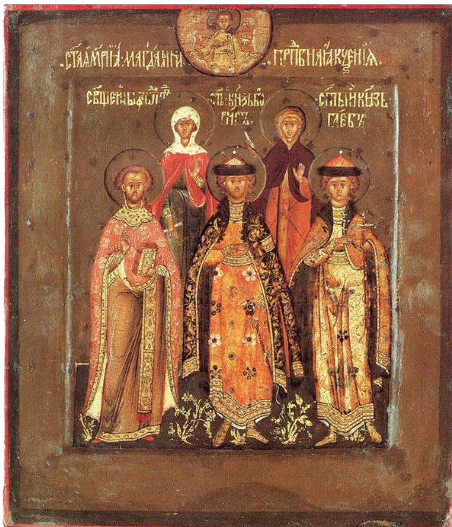
Ил. 3. Икона «Избранные святые», приписываемая Прокопию Чирину [Icons 1991: 106–107, № 556]