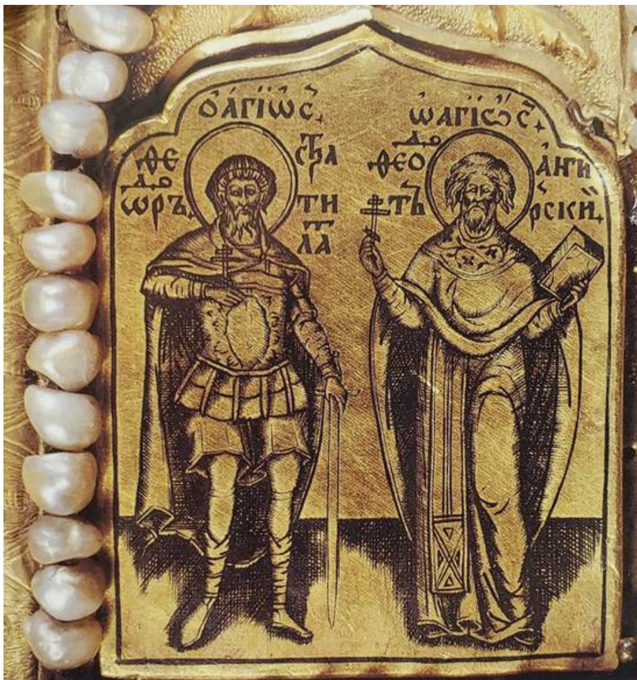
Ил. 1. Дробница с оклада иконы «Богоматерь Смоленская» [Мартынова 1999: 322, ил. 4]

иконе «Троица» из местного ряда Троицкого собора костромского Ипатьевского монастыря (вклад Дмитрия Ивановича Годунова) мы видим изображения апостола Филиппа (слева), Феодора Стратилата (в центре) и св. Феодота (справа) в виде святителя с Евангелием и подписью «священномученик Феодот» 33 . На внешней стороне одной из створок