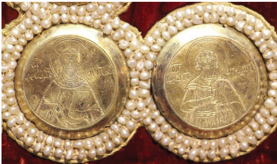
Ил. 7. Свв. Феодот Анкирский и Феодор Стратилат на дробницах с надгробного покрыва Федора Борисовича (Сергиево-Посадский государственный историко-художественный музей-заповедник, инв. № 2428)

ни самого Федора Борисовича уже не было на свете, а в живых оставалась лишь царевна Ксения Борисовна. Речь идет о синодике Стефанова Махрищского монастыря, которому в целом свойственна фиксация светской христианской двуименности. Запись о поминовении царской семьи выглядит следующим образом: