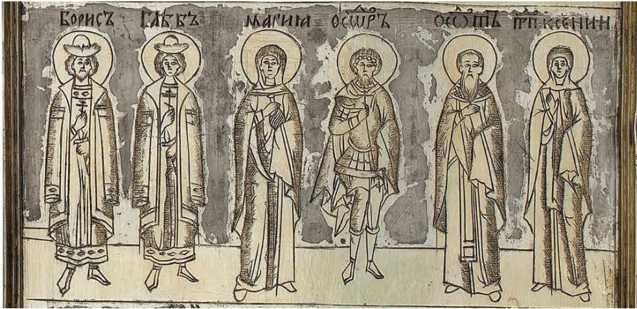
Ил. 2. Святые, соименные членам семьи Бориса Годунова (складень-«кузов» с иконой «Богоматерь Владимирская») [Гнутова 2018: 29]

складня-«кузова» с иконой «Богоматерь Владимирская» (возможно, также вклад царского дяди Д. И. Годунова) между изображениями Феодора Стратилата и преподобной Ксении мы находим фигуру в святительских одеждах с надписью «ΘΕΩΔΟΤЪ» [Гнутова 2018: 23, 29] (см. ил. 2).