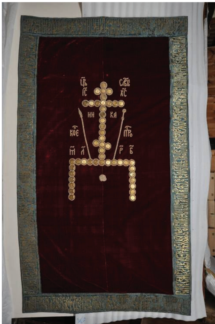
Надгробный покров Федора Борисовича (Сергиево-Посадский государственный историко-художественный музей- заповедник, инв. № 2428)