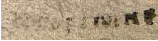
Илл. 2. Начало записи на л. 83 (85)

с меньшей степенью уверенности — либо заглавную И, либо заглавную W (второе вероятнее, если учесть формульный характер восклицания).