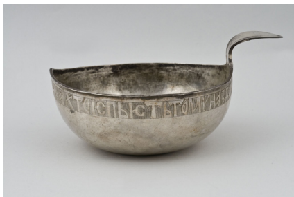
Рис. 1–3. Первый ковш пана Василия Братошича. Собрание В. В. Царенкова, Лондон