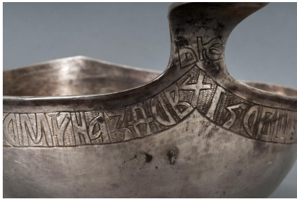
Рис. 7–9. Ковш княгини Ульяны. Собрание В. В. Царенкова, Лондон